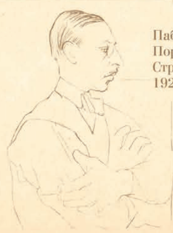
Пабло Пикассо. Портрет Игоря Стравинского. 1920